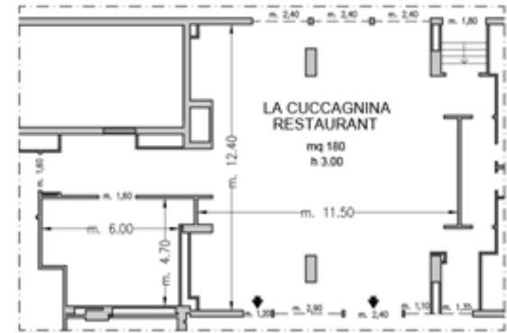
Piano Terra / Ground Floor